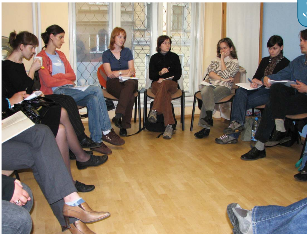
Občanské poradny zapojené do projektu pořádají pravidelné semináře pro širokou veřejnost. Foto ze semináře občanské poradny na Praze 3.

Specializované poradny i během letošních vánočních svátků řešily zvýšený zájem lidí o pomoc se zadlužováním, pořádaly se navíc preventivní semináře pro veřejnost.